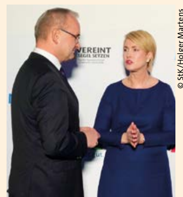
> dbb Landeschef Dietmar Knecht im Gespräch mit Ministerpräsidentin Manuela Schwesig

verfassungsgerichts umzusetzen“, betonte Knecht unter Hinweis auf die stilllose Verstümmelung des mit dem dbb lange ausgehandelten Besoldungsstrukturgesetzes zur amtsangemessenen Alimentation durch das Kabinett (siehe oben).