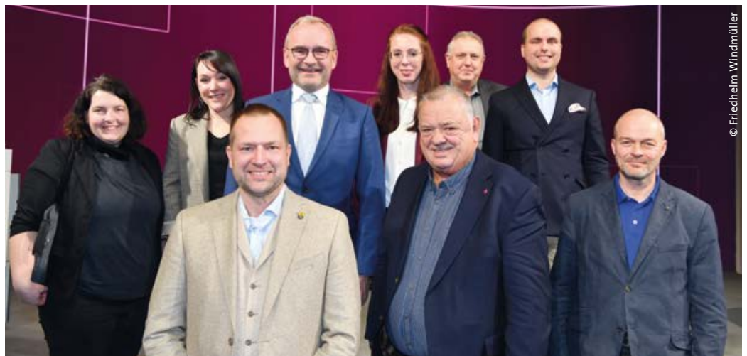
> Die Teilnehmer der dbb Jahrestagung 2024 aus M-V

Die Teilnehmer – unter ihnen erneut zahlreiche Vertreterinnen und Vertreter der Mitgliedsgewerkschaften des dbb m-v – befassten sich mit den aktuellen geopolitischen Herausforderungen und Spannungen. Diskutiert wurden unter anderem die bevorstehenden Wahlen in Europa und in einigen Bundesländern sowie vertrauensbildende Maßnahmen in Demokratie und Funktionsfähigkeit des Staates. Hochrangige Vertreter aus der Landes- und Bundespolitik wie Hendrik Wüst (CDU), Ministerpräsident des Landes Nordrhein-Westfalen, Hubertus