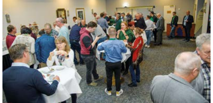
> Die Delegierten und Gäste nutzen die Pausen, um miteinander ins Gespräch zu kommen.

stand beziehungsweise eine frühere Rente zu vernünftigen finanziellen Bedingungen für die Beschäftigten einsetzen möge, die langjährig im unregelmäßigen Schichtdienst arbeiten.