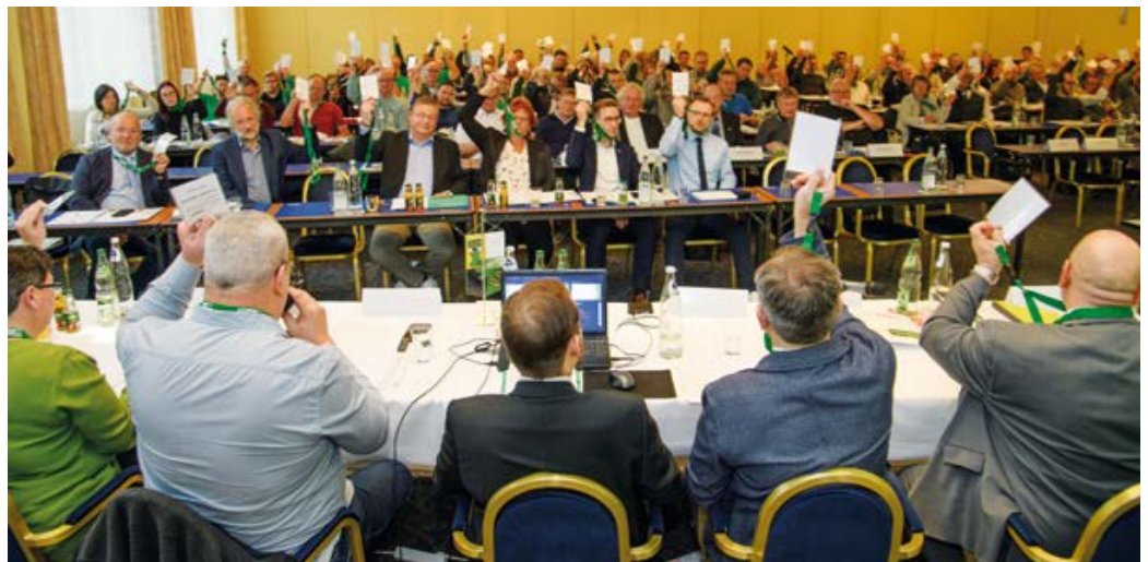
> Die Delegierten bei der Abstimmung über die Anträge