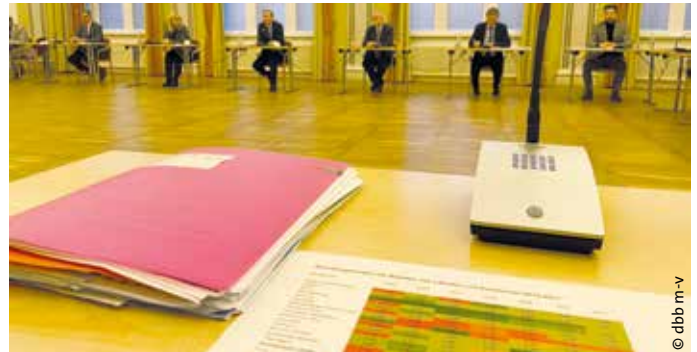
> Im Vergleich der Bundesländer haben Mecklenburg-Vorpommerns Beamtinnen und Beamte in der Vergangenheit oft weniger von den Tarifabschlüssen profitiert.

Unsere Einwände, insbesondere die Versorgungsempfängerinnen und Versorgungsempfänger zu berücksichtigen, die beispielsweise in der Pandemiephase in Pension gegangen sind und damit auch einen Anteil an der Beseitigung der Krise hatten, und darüber hinaus 23 Monate lang keine lineare Erhöhung erhalten würden, blieben unter anderem mit der Begründung unberücksichtigt, dass kein anderes Bundesland Einmalzahlungen für Versorgungsempfängerinnen und Versorgungsempfänger vornehmen wird. Weiterhin von der Einmalzahlung ausgenommen sind die Mitglieder der Landesregierung sowie die Präsidentin des Landesrechnungshofes.