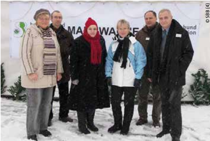
> Mahnwache 2007