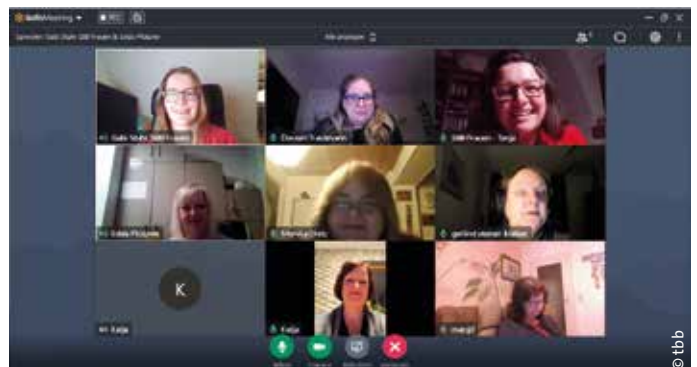
> Zur „Runden Ecke“ trafen sich Frauen aus Sachsen und Thüringen am 3. März 2021.

Am Ende war klar, so ein virtueller Stammtisch ist eine gute Möglichkeit, sich etwas ungewohnter auszutauschen. Vor allem waren sich die Beteiligten einig, dass man einen solchen Austausch über Ländergrenzen hinweg wiederholen sollte. Der Blick über den Tellerrand eröff-