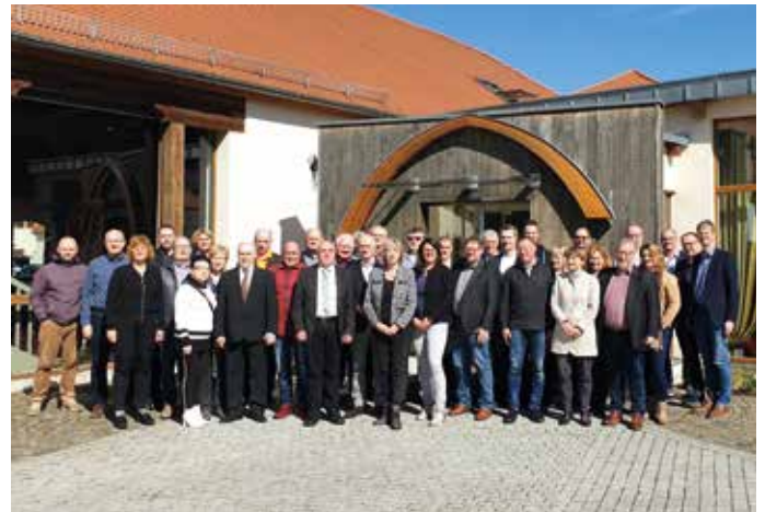
> Der Landesvorstand des SBB bei der Vorstandssitzung im März 2019.

Der SBB – als Spitzengewerkschaft der Beschäftigten des öffentlichen Dienstes und der privatisierten Bereiche – hat sich zu einer leistungsstarken und von der Politik geachteten Interessenvertretung entwickelt. Ich bin stolz, bei dieser Entwicklung nahezu 25 Jahre