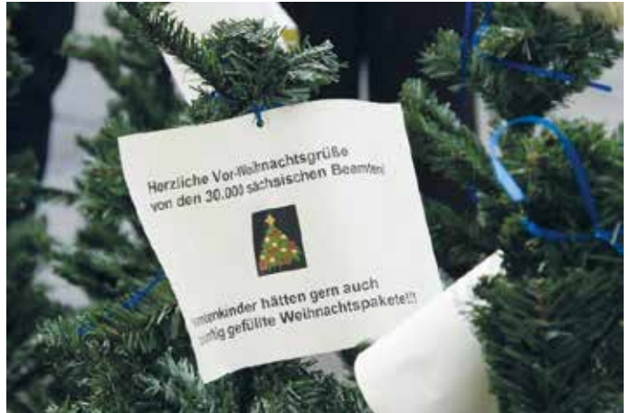
> 2007 wurden auch Weihnachtsbäume mit diesen Anhängern vor dem sächsischen Landtag platziert.

„Mahnwache“ vor dem verschneiten Landtag blieben leider erfolglos. Gleichzeitig wurden etliche Musterklagen besonders betroffener Beamte auf den Weg gebracht, die letztlich den Erfolg brachten.